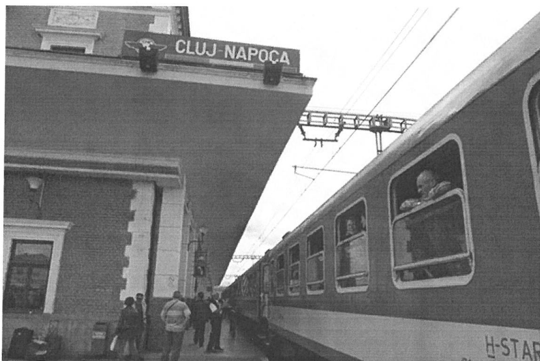
4. Ábra: Kolozsvári vasúti tábla

várakoztunk vonaton. Ott kezdtem megnyugodni, hogy azért itt is vannak nagyvárosok rendes utakkal, közlekedéssel és sok-sok emberrel. Itt csak az aggasztott, hogy a román nyelvet sem beszélni sem olvasni nem fogom tudni és hát persze minden hivatalos tábla, köztük a várost jelző vasúti tábla is egy nyelven, románul volt kiírva. Az ilyenre nem árt ha felkészül az ember előzetesen, illetve a másik ilyen dolog, amire fel kellett volna készülnöm az idő. Erdély már másik időzónába tartozik és egy órával több van ott Magyarországhoz képest, mondjuk ezt alig vettem észre, mivel a telefonom automatikusan átállt szolgáltató váltáskor.