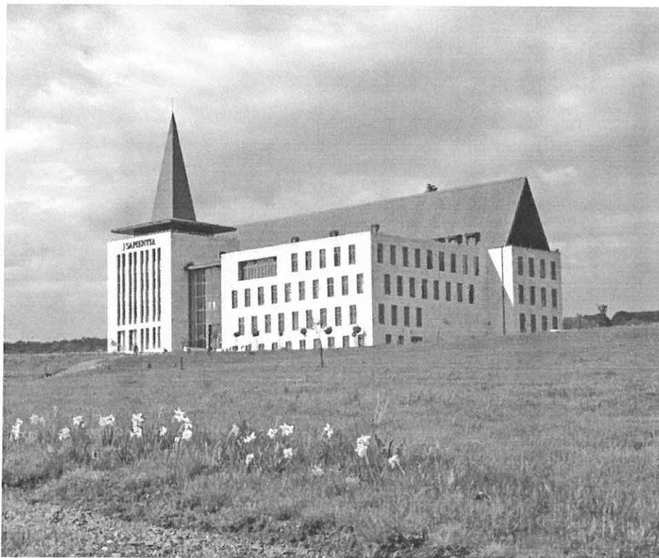
3. Ábra: Marosvásárhelyi Kar épülete

Kezdetben a város központjában található Deus Providebit Tanulmányi Házban zajlott az oktatás, majd ahogy a diáklétszám növekedett, úgy kellett egyéb helyszíneket is bevonni. A 2003 nyarán elkezdett zöldmezős beruházás eredményeképpen 2006-ban már minden hallgató az új, Marosvásárhely és Koronka határában felépült Campusban kezdhette el a tanévet. A korszerű oktatás kihívásainak minden szempontból megfelelő épületben három amfiteátrum és mintegy 40 előadóterem és jól felszerelt laboratórium biztosítja a diákok elméleti és gyakorlati felkészülését. Itt kaptak helyet az adminisztratív egységek, a tanszékek, a könyvtár, az étkezdé és a kávézó is. A kar főépületét körülvevő 27 hektár területen a kertészmérnöki szakos diákok gyakorlatoznak, akik parkosítják a terület egy részét.